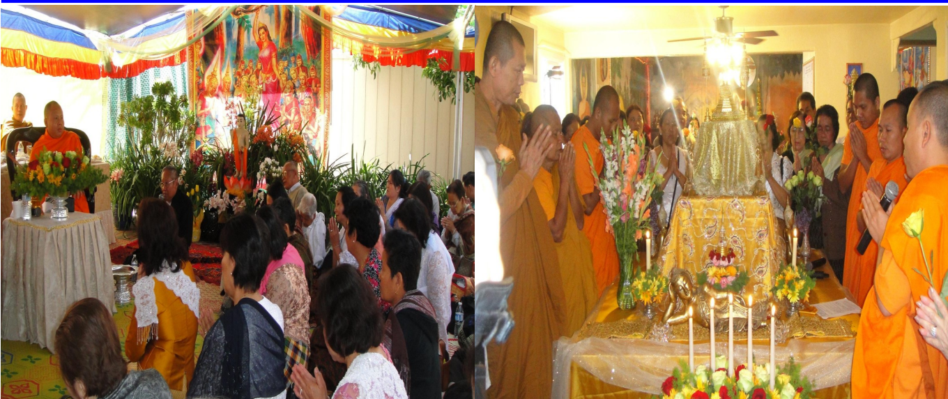
ទិដ្ឋភាពបុណ្យវិសាខបូជា នៅវត្តខេមរេង្គី ទីក្រុងសាន់ហូស្សេ នៃរដ្ឋកាលីហ្វ័រញ៉ា សហរដ្ឋអាមេរិក កាលពីខែឧសភា កន្លងទៅនេះ

ដើម្បីស្មិត្រលាស់ខ្លួន អោយរួចពីនឹមអនានិតមបារាំងសែស! មិត្តមិនដឹងជាព្រួយយ៉ាងណាទេ! ព្រោះខ្លាចបែកការណ៍ (ផែនការសំងាត់) របស់យើង! មិត្តអើយ ទោះបីអាចារ្យអបលក្សណ៍ទាំងនោះ យកអាវុធមកពុះទ្រូងរួងយកថ្លើមខ្ញុំក៏ដោយ ខ្ញុំមិនឆ្លើយប្រាប់នូវការណ៍ពិតទាំងនោះឡើយ!ខ្ញុំមិនសុខចិត្តឱ្យប្រទេសខ្ញុំស្លាប់ជាដាច់ខាតហើយខ្ញុំមិនសុខចិត្តរស់ ដោយឃើញប្រទេសខ្ញុំកញ្ជះគេដែរ។.....(តទៅទំព័រទី១៧)