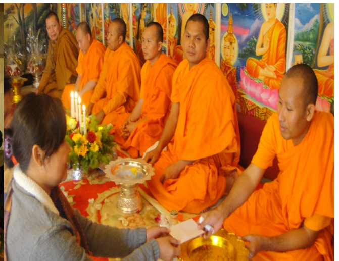
ព្រះសង្ឃ និងពុទ្ធបរិស័ទ វត្តខេមរេង្រី ទីក្រុងសាន់ហូស្សេ កំពុងគោរពប្រតិបត្តិ ព្រះសារីកធាតុ នៃព្រះសម្មាសម្ពុទ្ធ