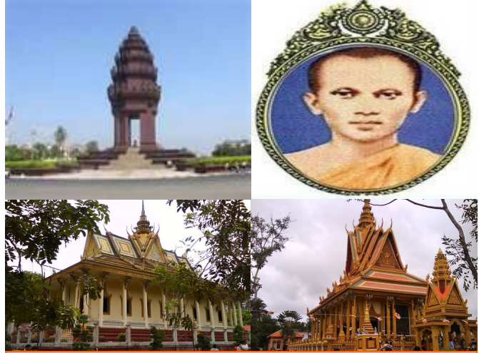
វត្តអារាមខ្មែរ, វិមានឯករាជ្យ, និងវិសមណៈ ហែម ចៀវ

ក្នុងពេលជាមួយគ្នានោះ លោក នួន ឌួង ក៏ត្រូវគិតបារាំងទៅចាប់ឯផ្ទះដែរ។នៅពេលដែលបារាំងចាប់ផ្លើរ លោក ត្រូវអាចារ្យ ហែម ចៀវ មានការឈឺចាប់ឥតឧបមា ធ្វើអោយទឹកនេត្រាលោកហូរដោយមិនដឹងខ្លួនលោកនឹកតូចចិត្តនឹងខ្មែរគ្នាឯងដែលធ្វើធំហើយមិនជួយឈឺឆ្កាលការពារកិត្តិយសព្រះសង្ឃ បែរជាបណ្តោយឱ្យជនបរទេសញាំញីតាមអំពើចិត្តរបស់គេ។ លោកគ្មាននឹកខ្លាចថា បារាំងធ្វើទារុណកម្មអ្វីទេ តែលោកនឹកស្តាយគំរោងការណ៍ ដែលនឹងជិតបានសំរេចផលផ្តល់ទៅអោយប្រជារាស្ត្រខ្មែរ ដែលរស់ក្នុងអន្លង់ទុក្ខក្រោមក្រញាំបិសាចបារាំង និងស្តេចយង់យួងជាច្រើនឆ្នាំមកហើយ។នៅក្នុងទីយុំយ៉ាង លោកអាចារ្យ ហែម ចៀវ អង្គុយសំលឹងតាមរន្ធតូចមួយមើលទៅមេឃដែលមានដុំពពករសាត់គ្រឿនៗ ប្រៀបដូចជាដុំទុក្ខផុសចេញពីក្រអៅបេះដូងនៃប្រជាជនរួមជាតិ។ ព្រះអាចារ្យពោលតែម្នាក់ឯងទាំងទឹកភ្នែកសស្រាក់៖ ឱ! ប្រទេសអញអើយ!តើកាលណាទៅនឹងបានឯករាជ្យ សម្បូសប្បាយដូចសម័យមហានគរវិញ។ បើមន្ត្រីធំៗ សុទ្ធសឹងលក់ក្បាលយ៉ាងដាច់ថ្លៃអោយបារាំងទៅហើយ..។តើថ្ងៃណាទើបខ្មែរយើងក្រោកពីដេក? ទើបខ្មែរស្គាល់ខ្លួនឯងជា