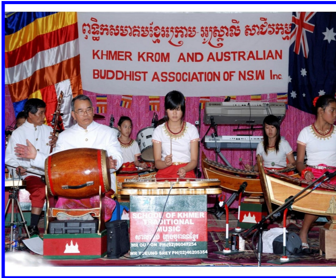
ក្រុមភ្លេងបុរាណខ្មែរកម្ពុជាក្រោម នៅប្រទេសអូស្ត្រាលី

ទ្រង់សោតូចមានមុខងារសំខាន់ដូចជាប្រើប្រាស់ នៅក្នុងវង់ភ្លេងមហោរី វង់ភ្លេងអាឃៃ វង់ភ្លេងការសម័យទំនើប មានក្រុមល្ខោនយីកេខ្លះមិនប្រើទ្រង់អ៊ូចំហៀងទេ គេប្រើទ្រង់សោតូចជំនួសវិញ។ ឥឡូវនេះប្រជាពលរដ្ឋបានយកវាទៅប្រើប្រាស់ជាមួយវង់ស្ត្រូនៃយុវ ជាបណ្តើរហើយនៅក្នុងវង់ភ្លេងជួនរបាំប្រពៃណីខ្លះ ក៏បានយកទ្រង់សោតូចនេះទៅប្រើប្រាស់ដែរ។សព្វថ្ងៃទ្រង់សោតូចមានប្រជាប្រិយភាពក្នុងចំណោមប្រជាពលរដ្ឋខ្លាំងណាស់ ជាងទ្រង់ដទៃទៀត។នៅក្នុងវង់ភ្លេងអាឃៃ និងនៅក្នុងវង់ភ្លេងការសម័យទំនើប ទ្រង់សោតូចមានមុខងារផ្ដើមចេញបទមុនគេបង្អស់។ ឧបករណ៍នេះមានរូបរាងតូច ប៉ុន្តែមានសំនៀងខ្លាំង មានដំណើរសាច់បទញឹកចង្អៀតជាងទ្រង់ដទៃ។