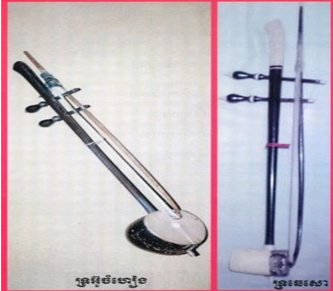
ឧបករណ៍ភ្លេងប្រពៃណីរបស់ខ្មែរតាំងពីបុរាណកាល

ក្រឡឹងលុងធ្វើជាបំពង់សំនៀង។ - ចំពោះទ្រសោធំ គេយកស្លឹកអណ្តើកឬ បំពង់ ឫស្សីជុនធំល្មមមកធ្វើបច្ចុប្បន្នធ្វើអំពីបំពង់ឈើ។ - ចំពោះទ្រសោតូច ទ្រឆេអ៊ូ ទ្រឆេសោ គេយកបំពង់ឫស្សីតូចល្មមមកធ្វើឥឡូវនេះគេក្រឡឹងលុងឈើល្អៗដូចជា ឈើនាងនួន ឈើបេង ឈើខ្មៅ ឈើត្រព្យង់ ឬក្តុកដំរីធ្វើជា បំពង់ជំនួសវិញ ។ ពួកទ្រនេះគេយកស្បែកពស់មកពាសធ្វើជាសន្ទះ។ - ចំពោះទ្រមានខ្សែ២ ទាំងអស់នេះ នៅពេលកូតម្តងៗ គេប្រើគល់ម្រាមដៃសំរាប់ចុចលើខ្សែសំនៀងមិនប្រើចុងម្រាមដៃដូចការកូតទ្ររបស់ជនជាតិចិនទេ។ មុខងារសំខាន់ៗរបស់ទ្រនីមួយៗ ៖