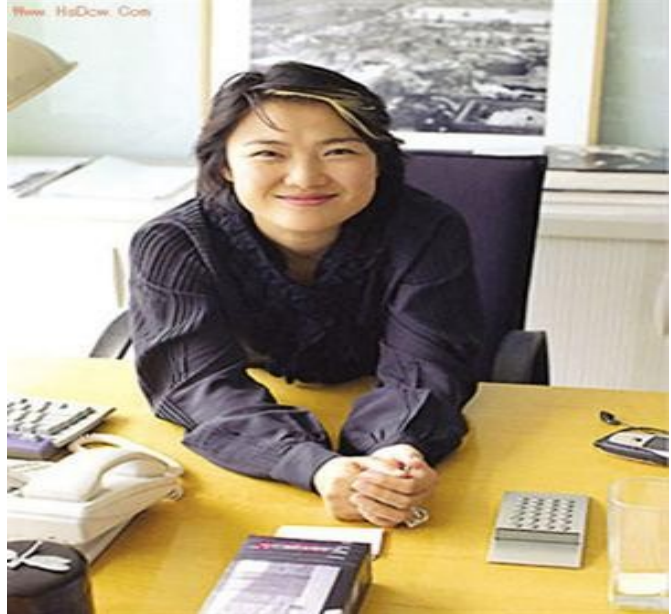
ស្ត្រីអ្នកជំនួញវ័យនៅអាស៊ី ដែលមានទ្រព្យសម្បត្តិច្រើន

មេរិក មានប្រាក់សរុបចំនួន២,១ពាន់លានដុល្លារអាមេរិក។