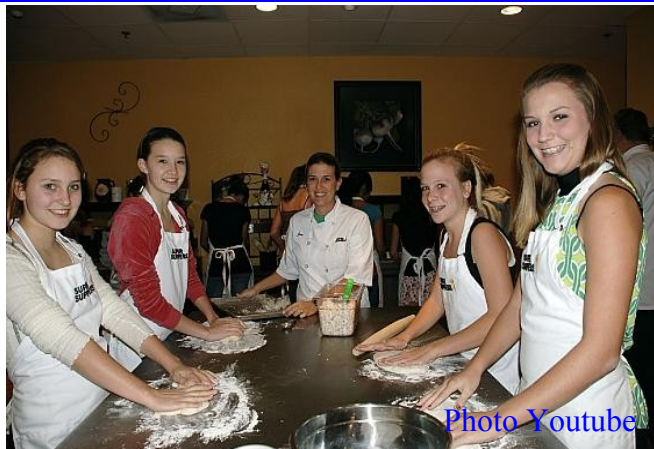
ក្រុមស្ត្រីដែលមិនប្រសប់ប្រជុំនាព្រាងកិច្ចការវិជ្ជាមេផ្ទះ

មួយសូមអ្នកនាងកុំធ្វើឱ្យប្តីរកកូសផ្លូវចិត្តឱ្យសោះ បើ នាងចេះស្រឡាញ់ប្តី អាណិតប្តី គួរណាស់តែអ្នកនាង គិតពីកម្លាំងប្តីផង ចាយវាយឱ្យមានសណ្តាប់ធ្នាប់..... ចេះគោរពលើកកំពស់កិត្តិយសប្តីចេះជួយការងារប្តីមិន ត្រូវស្តីកស្រពន់ត្រូវតែរវាស់រវែយលំដឹងរាក់ជ្រៅក្នុងសង្គ ម ទើបភាពចំរុងចំរើន សិរីសួស្តី កើតឡើងនិងមានមុខ មានមាត់ដល់គ្រួសារ អ្នកជិតខាងកោតសរសើរយកគំរូ តាម។ បុរសណាបានជួបប្រទះប្រពន្ធដែលគិតតែចាយ វាយគ្មានគិតកម្លាំងប្តី មិនលើកមុខនិងជួយប្តី មុខជារង ទុក្ខវេទនាអស់មួយជីវិត ទោះបីប្តីខំរកទាំងយប់ទាំងថ្ងៃ យ៉ាងណាក៏មិនឈ្នះនឹងប្រពន្ធ ដែលចាយគ្មានពិចារ ណានោះដែរហើយថែមទាំងមិនមានកិត្តិយសក្នុងសង្គ មទៀតផង។