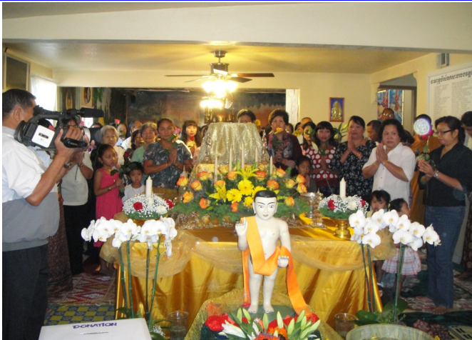
ការគោរពប្រតិបត្តិព្រះពុទ្ធសាសនា នៃសង្គមខ្មែរសព្វថ្ងៃ

រាប់ពាន់ឆ្នាំក្រោយមក បុគ្គលជា រាជានោះ មិនសូវបំពេញការងារអោយជាទីពេញ ចិត្តរបស់ពួកគេ ដូចជាលំអៀង, យោយៅព្រៃផ្សៃ និងភាពល្មើសជាដើម ។ ចាប់ពីពេលនោះមក តំណែងរាជា ជាតំណែង ដែលភាគច្រើនបានមកដោយការដណ្តើមគ្នា។ បុគ្គល ខ្លះមានសមត្ថភាពដណ្តើមមកតំណែងនេះហើយក៏ធ្វើ អោយមនុស្ស ស្រលាញ់ចូលចិត្តបានច្រើន ចំណែក អ្នកខ្លះមិនមានគុណធម៌ មិនមានយុត្តិធម៌ ក៏ប្រើសិទ្ធិ