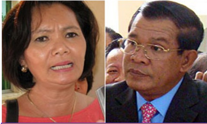
លោកស្រី មូរ សុខហ្មរ និងលោកនាយករដ្ឋមន្ត្រី

សាលាដំបូងរាជធានីភ្នំពេញ បានដាក់កំហិតឲ្យ តំណាងរាស្ត្របក្សប្រឆាំង លោកស្រី មូរ សុខហ្មរ ចំនួន ១០ថ្ងៃទៀត ចាប់ពីថ្ងៃព្រហស្បតិ៍ ទី១ ខែកក្កដានេះឲ្យ បង់លុយដំណើរចិត្តលោកនាយករដ្ឋមន្ត្រីហ៊ុន សែន ចំនួន ៨ លានរៀលបើមិនដូច្នោះទេតុលាការនឹងអនុវត្តតាមច្បាប់។