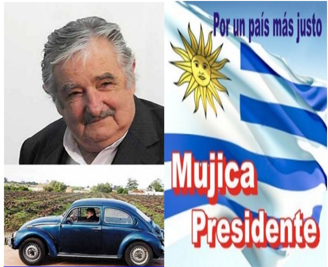
លោក Jose Mujica និងរថយន្តជុនតូចរបស់គាត់

យោងតាមសារព័ត៌មាន Chosun កូរ៉េខាងត្បូង បានចុះផ្សាយនូវសេចក្តីប្រកាសស្តីពីហិរញ្ញវត្ថុ របស់រដ្ឋាភិ បាលអ៊ុយរ៉ាហ្គាយ បានបង្ហាញឱ្យដឹងថា លោក Jose Mujica ប្រធានាធិបតីអ៊ុយរ៉ាហ្គាយបច្ចុប្បន្ន គឺជា ប្រធានាធិបតីក្រ ជាងគេបំផុតនៅលើពិភពលោក។