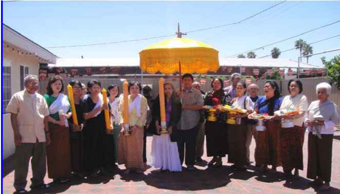
ពុទ្ធបរិស័ទដង្ហែរទៀនវស្សា ប្រគេនព្រះសង្ឃវត្តខេមរេង្រី

ក/ បើដឹងថាមាតាបិតាឬគ្រូឧបជ្ឈាយាចារ្យមាន ធុរៈរឺពេកាព្យាធិណាមួយកើតឡើងអាចនិមន្តទៅបាន។