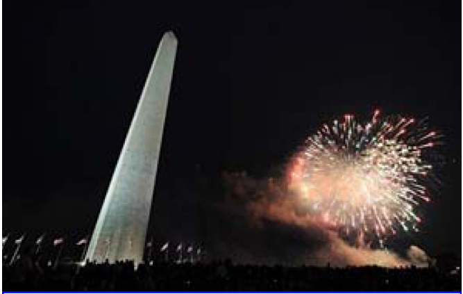
ពលរដ្ឋអាមេរិកបាញ់កាំជ្រួចអបអរសាទរ ថ្ងៃបុណ្យឯករាជ្យជាតិ

នៅខែធ្នូ ឆ្នាំ១៧៧៣ សំពៅដឹកទំនិញពីប្រទេសអង់គ្លេសចំនួន៣គ្រឿង ចូលមកសំចតនៅកំពង់ផែក្រុង Boston រដ្ឋម៉ាសាឈូសិត តែពួកគេយអង់គ្លេសមិនអនុញ្ញាតឱ្យផ្ទេរទំនិញ ទាល់តែបង់ពន្ធឱ្យគេជាមុន