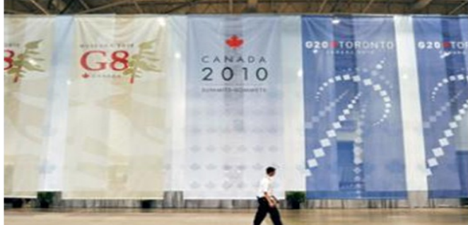
ជំនួបកំពូល G8/G20 នៅកាណាដា ពីថ្ងៃសុក្រទី២៥ ដល់ថ្ងៃ អាទិត្យ ទី២៧ មិថុនា ២០១០

នៅមុនពេលបើកជំនួបកំពូល លោកអូបាម៉ា បានទូរស័ព្ទទៅកាន់នាយករដ្ឋមន្ត្រីអង់គ្លេស និងប្រមុខ រដ្ឋាភិបាលអាឡឺម៉ង់ ដើម្បីសម្ដែងនូវកង្វល់របស់លោក ចំពោះនយោបាយសន្សំសំចៃរបស់អឺរ៉ុប។ ក៏ប៉ុន្តែ ប្រមុខ រដ្ឋាភិបាលអាឡឺម៉ង់ លោកស្រី អង់ហ្គេឡា មែរកិល (Angela Merkel) បានអះអាងថា ការកាត់បន្ថយការ ចំណាយនៅអឺរ៉ុបនឹងមិនធ្វើឲ្យរាំងស្ទះដល់កំណើនសេ