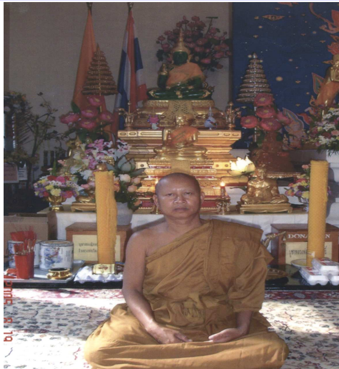
ព្រះមហាប្រសិទ្ធិវារៈកាន់ ព្រះចៅអធិការវត្តរតនគិរីវង្ស

កាលពីថ្ងៃទី៣០ខែឧសភាឆ្នាំ២០១០កន្លងទៅ ថ្មីៗនេះ គណៈកម្មការ អាចារ្យវត្ត ព្រមទាំងពុទ្ធបរិស័ទ វត្តរតនគិរីវង្ស នាទីក្រុង San Bernardino រដ្ឋកាលីហ្វ័រញ៉ា មានទុក្ខក្រៀមក្រំជាទីបំផុត ដោយព្រះ មហាប្រសិទ្ធិវារៈកាន់ ដែលជាលោកគ្រូចៅអធិការវត្ត ព្រះអង្គបានទទួលអនិច្ចធម្ម កាលពីវេលាម៉ោង