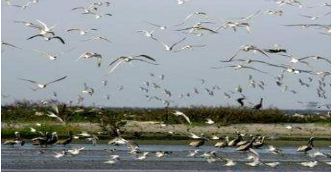
តំបន់ឆ្នេរសមុទ្រនៅរដ្ឋ Louisiana សហរដ្ឋអាមេរិក

ការផ្ទុះស្ថានីយ៍បូមប្រេងមួយ របស់ក្រុមហ៊ុនប្រេងឥន្ធនៈអង់គ្លេសឈ្មោះ Bp នៅឈូងសមុទ្រ Mexico កាលពីសប្តាហ៍មុន បានធ្វើឲ្យប្រេងឆៅឆ្លាយចេញអណ្តែតរសាត់ពាសពេញទឹកសមុទ្រ។ ប្រេងឆៅបានអណ្តែតរសាត់ទៅដល់ឆ្នេរសមុទ្រនៃរដ្ឋ Louisiana សហរដ្ឋអាមេរិក។ ជាព្រឹត្តិការណ៍មួយដែលបានជម្រុញឲ្យរដ្ឋាភិបាលប្រកាសចាត់ទុក..... (តទៅទំព័រទី២៤)