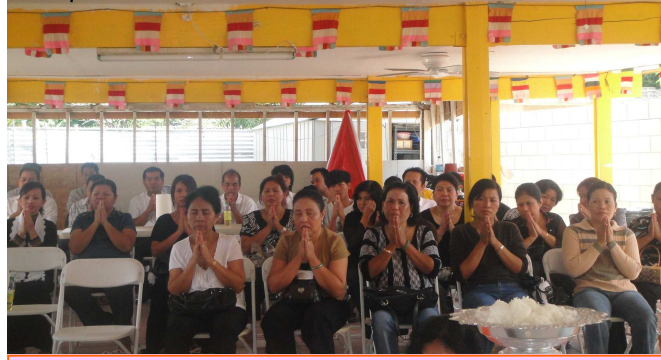
ពុទ្ធបរិស័ទចូលរួមពិធីបុណ្យបង្ហូរកូលព្រះមហាប្រសិទ្ធិវារៈកាន់

ពុទ្ធបរិស័ទធ្វើទានបំពេញកុសល រហូតដល់ថ្ងៃព្រះអង្គ ទទួលអនិច្ចធម្ម។