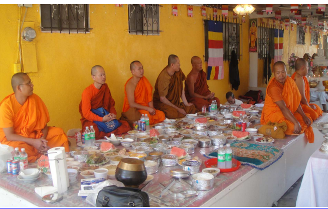
ព្រះសង្ឃវត្តខេមរង្សីនិមន្តទៅចូលរួមធ្វើពិធីបង្ហូរកូល ប្រគេន ចំពោះព្រះវិញ្ញាណក្ខន្ធព្រះមហាប្រសិទ្ធិវារៈកាន់ចៅអធិការ វត្តរតនគិរីវង្ស នៅទីក្រុង San Bernardino

ព្រះពុទ្ធសាសនា ជាសាសនាមួយដឹកនាំមនុស្ស មិនឱ្យប្រកាន់វណ្ណៈ ពូជសាសន៍អ្វីទេ ហេតុនេះទើបគណៈកម្មការ អាចារ្យនិងពុទ្ធបរិស័ទបាននិមន្តលោកគង់ នៅក្នុង វត្តរតនគិរីវង្ស ដើម្បីជាស្រែបុណ្យសំរាប់