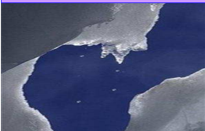
ស្ថានភាពទឹកកកកំពុងរលាយយ៉ាងឆាប់រហ័ស

ទេ ប៉ុន្តែចាប់ពីឆ្នាំ២៣០០តទៅ សីតុណ្ហភាពអាចកើនខ្ពស់ដល់ទៅ១២អង្សាសេ ឬច្រើនជាងនេះ។