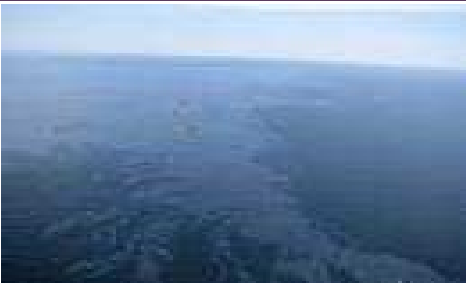
ប្រេងឆៅអណ្តែតលើទឹកសមុទ្រប្រវែង៩០០គីឡូម៉ែត្រ

បើយោងតាមអ្នកឯកទេសខាងបរិស្ថានប្រេងឆៅ ដែលបានឆ្លាយចេញពីការផ្ទុះស្ថានីយ៍បូមប្រេងមួយរបស់ ក្រុមហ៊ុនប្រេងឥន្ធនៈអង់គ្លេសឈ្មោះ BP នៅឈូងសមុទ្រ មិកស៊ិកកាលពីសប្តាហ៍មុន គឺជាមហន្តរាយមួយ ដែលនឹង អាចផ្តល់ផលអាក្រក់ជាងការផ្ទុះស្ថានីយ៍បូមប្រេង Exxon Valdez នៅក្នុងរដ្ឋអាឡាស្កា កាលពី ២៥ឆ្នាំ មុនទៅទៀត។ កាលណោះ ប្រេងឆៅ ដែលឆ្លាយចេញពីការផ្ទុះនោះ