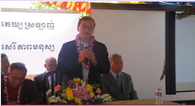
លោក សម រង្ស៊ី ប្រធានគណៈបក្ស សម រង្ស៊ី

បន្ទាប់ពីការឧទ្ទេសនាម និងចំណាប់អារម្មណ៍របស់ថ្នាក់ដឹកនាំសាខាគណៈបក្សសម រង្ស៊ី ប្រចាំនៅទីក្រុងសាន់ហូស្សេរួចមក លោកប្រធានសម រង្ស៊ីបានធ្វើសេចក្តីថ្លែងការណ៍ ស្តីពីព្រឹត្តិការណ៍យ៉ាងក្តៅកក គឺបញ្ហាបង្គោលព្រំដែន រវាងប្រទេសកម្ពុជា និងប្រទេសវៀតណាមនៅខេត្តស្វាយរៀង កាលពីពេលថ្មីៗនេះ។