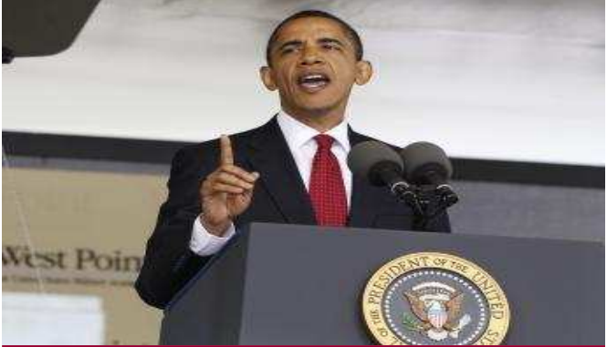
លោកប្រធានាធិបតីថ្លែងការនៅបណ្ឌិតសភាយោធា West Point

ថ្ងៃទៅកាន់នាយទាហាននៅបណ្ឌិតសភា យោធា West Point លោកប្រធានាធិបតីបារ៉ាក់អូបាម៉ាបានចង្អុលឲ្យដឹងនូវគោលនយោបាយយុទ្ធសាស្ត្រអាមេរិកពាក់ព័ន្ធនឹងបញ្ហាសន្តិសុខជាតិ ដែលនឹងត្រូវប្រកាសឲ្យដឹងជាសាធារណៈនៅពេលខាងមុខនេះ។ ហើយអ្វីដែលគួរឲ្យកត់សម្គាល់គឺយុទ្ធសាស្ត្ររបស់លោកអូបាម៉ាមាន លក្ខណៈខុសពីយុទ្ធសាស្ត្រនៃប្រធានាធិបតីអាមេរិកមុនៗ។ ទល់នឹងទ្រឹស្តីនៃការធ្វើសង្គ្រាមដើម្បីការពារខ្លួននៅករណីដែលគេយល់ថា អាចមានការគំរាមដែលលោកអតីតប្រធានាធិបតី George W Bush បានថ្លែងនៅបណ្ឌិតសភាយោធា West Point នៅខែមិថុនាឆ្នាំ២០០២ លោកប្រធានាធិបតីបារ៉ាក់អូបាម៉ាបានថ្លែងប្រកាសឲ្យដឹងថា លោកនិយមរបៀបរបបអន្តរជាតិថ្មី ជាង ទ្រឹស្តីនៃការធ្វើសង្គ្រាមដើម្បីការពារខ្លួនរបស់លោកអតីតប្រធានាធិបតី George W Bush ។ របៀបរបបអន្តរជាតិថ្មី ដែលឈរលើគោលការណ៍សហប្រតិបត្តិការជាដៃគូជាមួយប្រទេសដទៃទៀតក្នុងលោកដើម្បីប្រយុទ្ធតទល់ ហើយនិងវិវត្តន៍នៃស្រាយឲ្យបញ្ហាសេដ្ឋកិច្ចបញ្ហាយោធានិងបញ្ហាដែលមាននៅជុំវិញខ្លួនយើង។