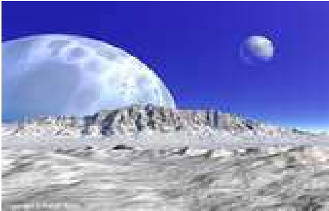
ស្ថានភាពទឹកកកកំពុងចាប់ផ្តើមកកតាមឆ្នេរសមុទ្រ

លោកឈីរ៉ូដ បានបន្តទៀតថា មនុស្សធ្វើអ្វីៗមិនបានច្រើនទាក់ទងនឹងការប្រែប្រួលអាកាសធាតុក្នុងរយៈពេល២សតវត្សខាងមុខ ប៉ុន្តែនៅមានវត្ត ដែលយើងអាចធ្វើបានជាច្រើនទៀតសំរាប់បំបំប្លែងក្នុងរយៈពេលវែង។ លើសពីនេះ ការបង្ហាញគំនិតយល់ឃើញរបស់ការងារស្រាវជ្រាវនេះ ដែលរក្សាទុកធ្វើជាឯកសារនៅក្នុងមហាវិទ្យាល័យជាតិអូស្ត្រាលីបានបញ្ជាក់ថាការប្រែប្រួលអាកាសធាតុនឹងមិនបញ្ឈប់នៅត្រឹមឆ្នាំ២១០០