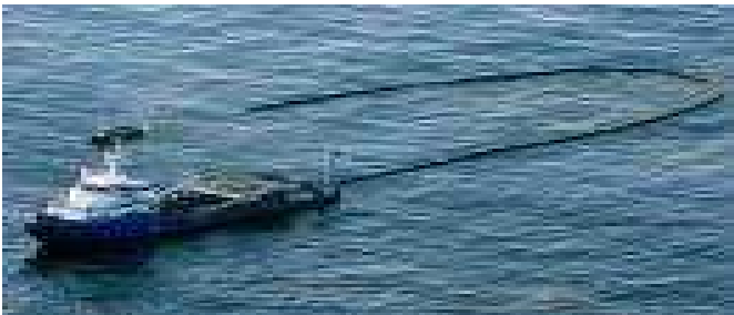
ប្រតិបត្តិការបោសសំអាតប្រេងឆៅនៅលើផ្ទៃទឹកសមុទ្រ