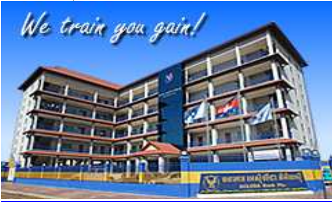
ធនាគារ អេស៊ីលីដា គីអិលស៊ី នៅប្រទេសកម្ពុជា