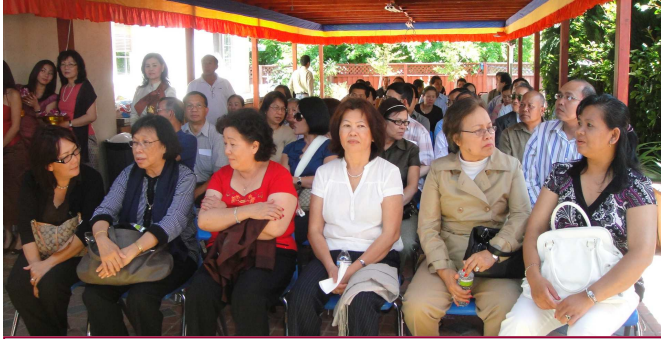
ប្រជាពលរដ្ឋខ្មែរ ចូលរួមស្តាប់សេចក្តីថ្លែងការណ៍ របស់លោក សម រង្សី នៅវត្តខេមរារង្សី នាទីក្រុងសាន់ហូស្សេ