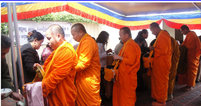
ព្រះសង្ឃនិមន្តបិណ្ឌបាត្រ នៅពេលបុណ្យវិសាខបូជា នាវត្តខេមរង្សី

បន្ត ទោះបីនៅក្នុងអង្គការ សមាគមបុរាណវិទ្យាភិក្ខុ យោង តាមទ្រឹស្តីព្រះពុទ្ធសាសនា បានបញ្ជាក់យ៉ាងច្បាស់ថា ការ កសាងអំពើល្អ អាក្រក់សំរាប់ខ្លួនឯងម្នាក់គាត់ មិនអាច អូសទាញអ្នកអត់កំហុសមកលាយឡំជាមួយបានទេហេតុ នេះសូមពុទ្ធបរិស័ទគ្រិះរិះពិចារណាធ្វើយ៉ាងណារួមចិត្តរួម គំនិតថែរក្សាសាសនាព្រះពុទ្ធឱ្យបានរុងរឿង ប្រកបដោយ សទ្ធាជ្រះថ្លា។ ម្យ៉ាងទៀតបើយើងមិនសប្បាយចិត្តនឹងបុគ្គលណាម្នាក់ សូមកុំស្អប់ដល់សង្គមបុរាណវិទ្យា ព្រោះអ្នក ដែលកំពុងធ្វើការងារបន្តគឺជាអ្នករងគ្រោះ។